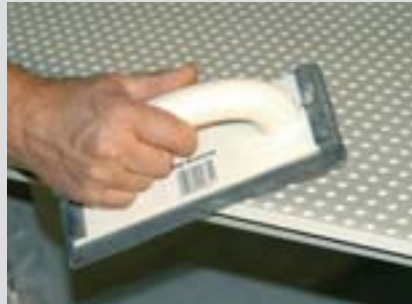
Hrany desky musí být zbrošeny.