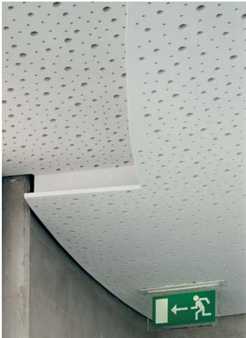
Akustické desky jako ze škatulky

Spárovací hmota Knauf Jet-Filler, která je připravena k okamžitému použití, se vyznačuje homogenní konzistencí a jednoduchou manipulací. Doba přípravy a čištění náradí při použití práškových materiálů pro spárování velkých ploch v objektech patří minulosti. Optimalizovaná systémová sada Knauf Jet-Set, která se skládá z pistole se speciální tryskou Jet a tmelu Jet-Filler přispívá při zpracování k vysoké efektivitě a tedy i k časové úspoře.