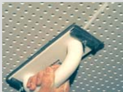
Po vytvrdnutí Jet-Filleru se spára přebrousí.