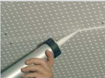
Spáry vyplnit dostatečně Knauf Jet-Fillerem.