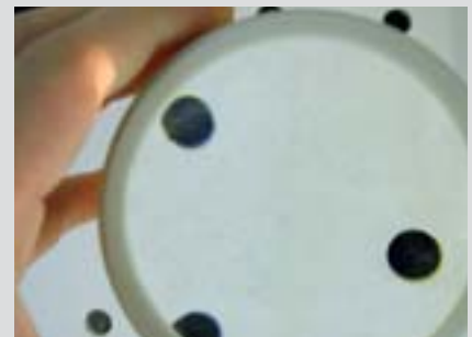
...hotová plocha – jako ze škatulky.