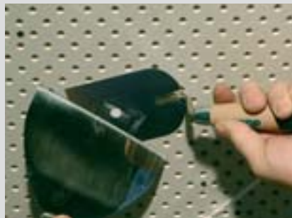
Upevňovací šrouby zatmelit také Jet-Fillerem tak, aby tmel lehce vystupoval z úrovně povrchu desky.