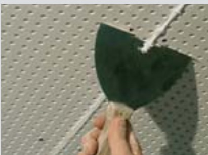
Po cca 10 minutách odstranit špachtlí přebývající materiál tak, aby materiál mírně vystupoval z úrovně povrchu desky.