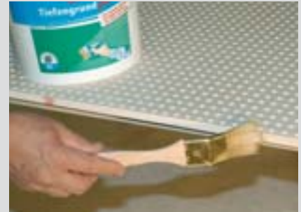
Hrany napenetrovat nátěrem Knauf Tiefengrund.